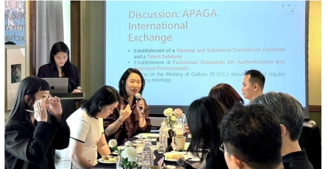
▲Case Study 分享與討論